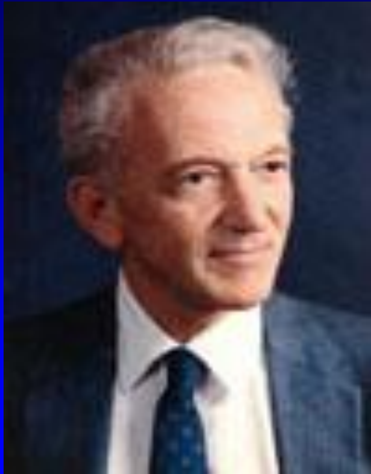
prof. Peter Safar